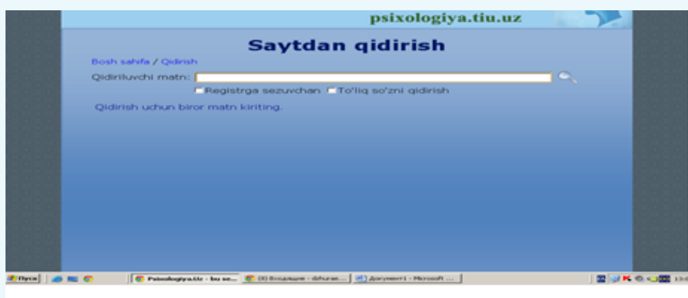
3-расм. Қидириш менюси ойнаси.