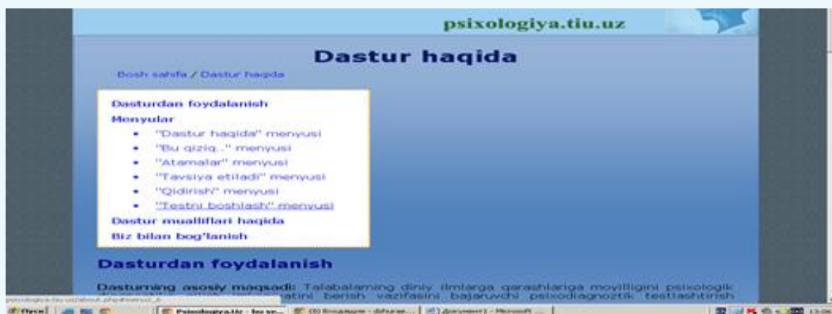
2-расм. Дастурни ўрнатиш ва ишга тушириш ойнаси.